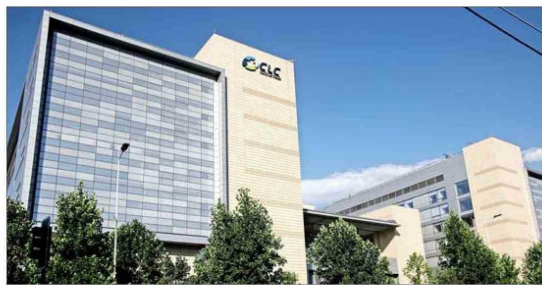
La operación busca fortalecer a la sociedad ante los retrasos de pagos de Fonasa e isapres, sostuvo la compañía.

La operación busca fortalecer a la sociedad ante los retrasos de