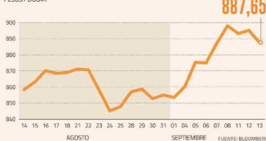
DÓLAR EN EL MES PESOS / DÓLAR

Sumado a esto, el tipo de cambio escaló desde niveles de $ 790 a $ 810 verificados entre marzo y julio a las cercanías de $ 900 en septiembre. Aquí peso el aumento del diferencial de tasas de interés entre Chile y Estados Unidos y una mayor turbulencia en los mercados