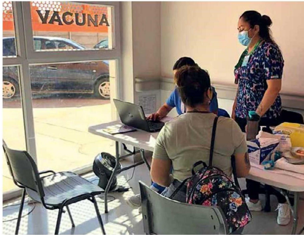
Seremi de Salud de O'Higgins llamó a la comunidad a vacunarse contra la influenza y el Covid-19, inmunización que se puede coadministrar en ambos brazos.

"Se han notificado de algunos casos positivos para SARS-CoV-2 distintos establecimientos y en ese contexto, en aquellos lugares donde hemos detectado varios casos, se ha instruido el desarrollo de búsquedas activas. Así que también es importante que nuestra comunidad recuerde que en toda la región se pueden acceder a test ya sea PCR o antígeno y estamos ayudando a contener la pandemia, dado que es esperable que cuando tengamos concentración de población podamos tener algún riesgo de contagios más importantes", indicó