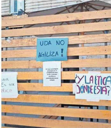
EN DISTINTOS PUNTOS DE LA UNIVERSIDAD HAY PANCARTAS.

En horas de la tarde de ayer, los distintos centros de alumnos se reunieron para analizar las situaciones y se podrían sumar otras carreras a la