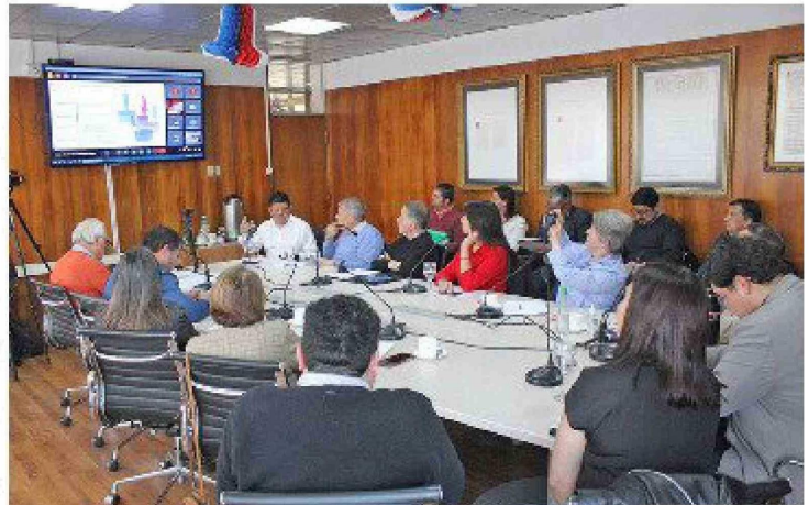
Sorprendidos y atónitos quedaron muchos sobre el informe final de la situación financiera de la CORMUN presentada en sesión extraordinaria del Concejo Municipal de Rancagua.

"Conmocionado" se mostró el senador por O'Higgins, Juan Luis Castro con lo ocurrido el pasado jueves en la sesión extraordinaria del Concejo Municipal de Rancagua, ya que alega que, a cinco meses de la administración suplente del municipio y a tres semanas de las elecciones, que se descubra hoy lo que la Contraloría General de la República dijo por escrito el 23 de diciembre del año 2022, es inaudito. "Estamos hablando de hace casi dos años atrás, cuando el ente auditor