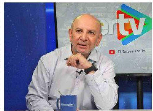
El senador Juan Luis Castro, dijo sentirse "conmocionado" por lo revelado en el informe final y la crisis financiera por la que atraviesa la CORMUN de Rancagua.

"Yo lo que trato de entender, y no puedo, es que, en un momento tan delicado, sobre todo cuando ya se está a punto de entregar