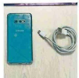
EL CELULAR DESCUBIERTO.