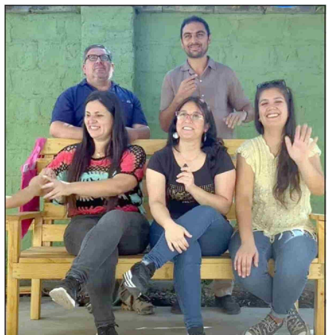
Organizadores de la actividad cultural.