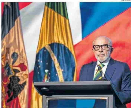
PRESIDENTE DE BRASIL PARTICIPÓ EN EL ENCUENTRO.