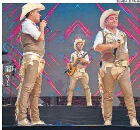
EL GRUPO ZÚMBALE PRIMO SERÁ PARTE DE LA GIRA.

josa y el grupo folclórico Entremares, entre otros, además de algunos artistas locales que varían según cada ciudad.