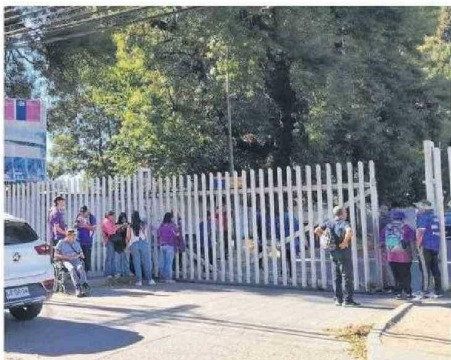
Hinchas de Deportes Concepción esperaron en las afueras del estadio Ester Roa previa a la suspensión del duelo por Copa Chile.

el corte, EFE Sur informó en sus redes sociales que "por corte de electricidad externo, nuestros servicios de L2 y L1 se encuentran temporalmente detenidos", sin reanudación durante el resto de la tarde.