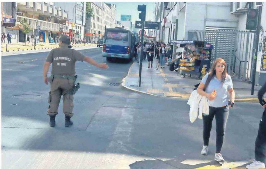
Varias aglomeraciones se vieron en los paraderos del transporte público durante la tarde en el Gran Concepción.

El primer indicio de los efectos del masivo corte de energía estuvo en el servicio del Biotren, donde sólo a 17 minutos de ocurrido