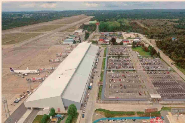
El Tepual, en Puerto Montt, es la puerta de acceso del tráfico aéreo para con la zona sur del Chile