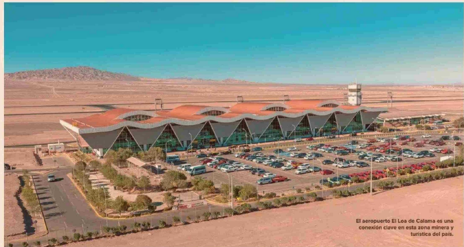
El aeropuerto El Loa de Calama es una conexión clave en esta zona minera y turística del país.

El inicio de la segunda concesión del aeropuerto de Copiapó, en la comuna de Caldera, considera el aumento de la superficie del terminal de pasajeros, quintuplicando el tamaño de la actual terminal. El proyecto incluye la incorporación nuevos puentes de embarque, estacionamientos para aeronaves comerciales,