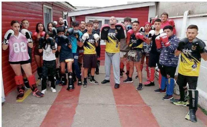
UNA JORNADA DE ENTRENAMIENTO JUNTO A LOS ALUMNOS Y ATLETAS DE ELITE THAI BOX.