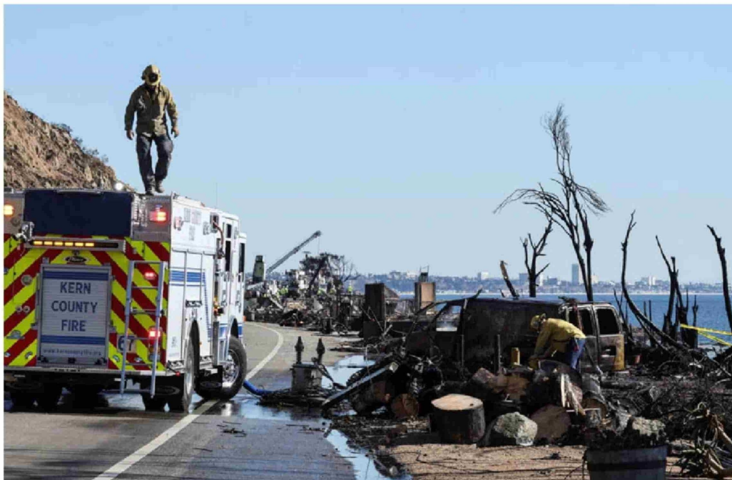
► Vista de un camión de bomberos después del incendio Palisades a lo largo de la costa del Pacífico en Malibú, California.

Dos vecindarios, que en conjunto albergan a unas 66.000 personas, sufrieron una devastación casi total: Altadena, en las sinuosas colinas al este que alguna vez sirvieron como refugio para las familias negras de clase media