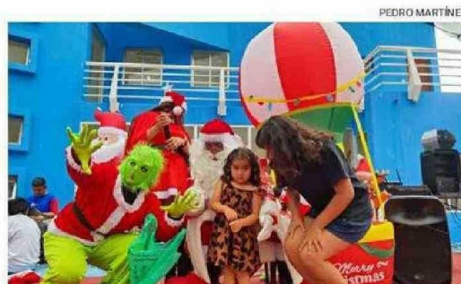
LOS QUE MÁS DISFRUTARON CON LA ACTIVIDAD FUERON LOS NIÑOS Y NIÑAS.