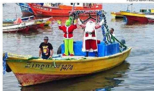
EL TAMBIÉN CONOCIDO COMO "VIEJITO PPASCUERO" LLEGANDO A CALDERA.