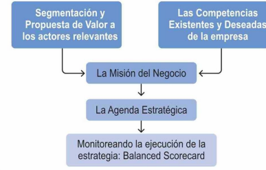
Figura 2. El proceso de definición de la Misión y de la Agenda Estratégica

Posteriormente siguen los otros pasos: la definición de misión y los cambios que implica en la propuesta de valor a clientes, el ámbito y las competencias distintivas; la definición de la "agenda estratégica", que contiene información detallada de los "programas de acción estratégicos" con una clara definición de plazos,