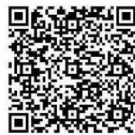
ESCANEA ESTE QR EN TU SMARTPHONE PARA VER EL EPISODIO 28 DE DESTINO INNOVACIÓN EN SOYTVCL.