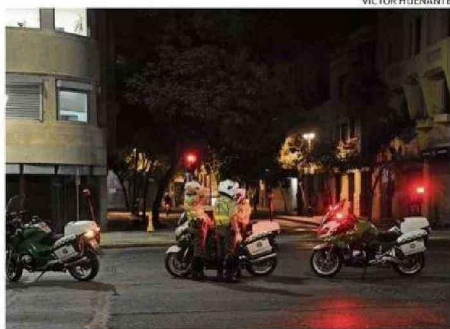
AYER SE LEVANTÓ EL TOQUE DE QUEDA PARA LAS REGIONES AFECTADAS.

A su vez, informó que habrán tres tipos de compensaciones. La primera tiene que ver con el caso de fallas de transmisión. "Corresponde una compensación por todo el tiempo de duración del suministro, que es del orden de 15 meses del precio de la energía no suministrada", dijo Pardow, quien aseguró que en este caso los descuentos se realizarían de manera automática en las cuentas de la luz, los