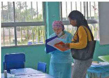
Más de 280 personas recibieron atención de salud en una jornada con especialistas y terapias complementarias.

E l pasado sábado, el Rotary Club Cachapoal, junto a otros clubes rotarios de la región y Santiago, llevó a cabo un exitoso Operativo Médico Interclubes en el Colegio Jean Piaget, ubicado en el sector poniente de la ciudad. La actividad, desarrollada entre las 10:00 y las 16:30 horas, ofreció atenciones gratuitas en diversas áreas de la salud a más de 280 personas.