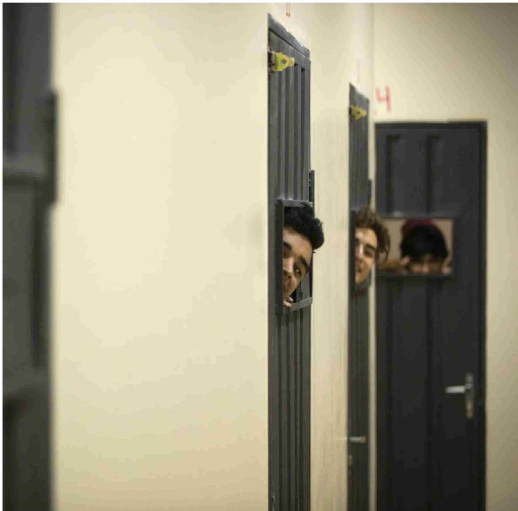
► El riesgo de quitarse la vida es de 4 veces para los hombres y para las mujeres aumenta hasta 10 veces

Bueno, Mundt adelanta que Chile tiene una tasa que está dentro del promedio y de lo esperable para la región. "Comparamos en este estudio mundial regiones y países con altos versus bajos y medianos ingresos per cápita, y se veía que en Europa y en los países con altos ingresos las tasas de suicidio son más altas aún", comenta. En general, en Chile y América Latina, las tasas son un poco más bajas que en Europa, pero han sido más altas, por