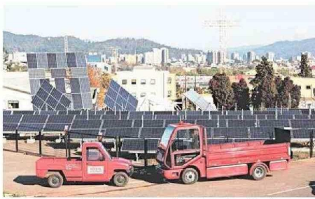
Programas como el Diplomado en Educación Ambiental, Certificación y Sustentabilidad, y Diplomado en Electromovilidad son solo algunos de los 72 ofertados por la casa de estudios superiores.

La innovación, sostenibilidad y energía, son áreas importantes que se abordan en los programas actualmente vigentes.