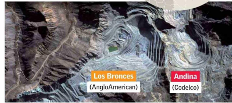
Producción de Andina y Los Bronces En miles de toneladas de cobre fino.