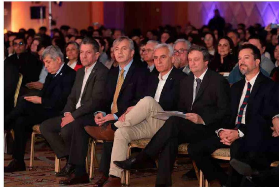
Importantes personalidades de la vida regional y nacional asistieron a la instalación del ENEO 2024.

empresarios que generan una economía circular, ya que sus ganancias se quedan en la región. Agradeció la invitación a este evento y el trabajo colaborativo que están haciendo con el mundo privado y asimismo creyendo en esto, porque, "no es el mundo privado contra el mundo público, sino un trabajo colaborativo que hace más fácil el desarrollo y crecimiento de la región de O'Higgins, una de las regiones más lindas del país".