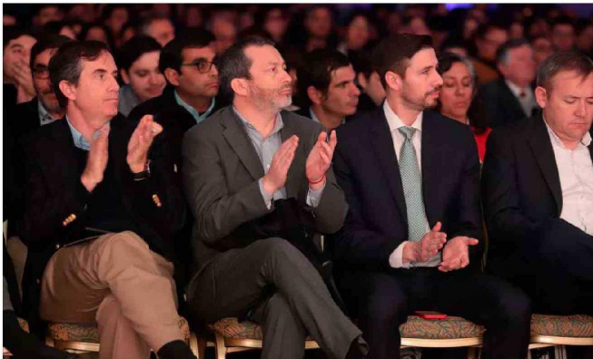
Personalidades del mundo empresarial del país y de O'Higgins participaron del encuentro organizado por la Corporación Pro O'Higgins.