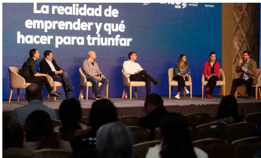
Los panelistas que cerraron el evento enfocados en "Historias que Inspiran".