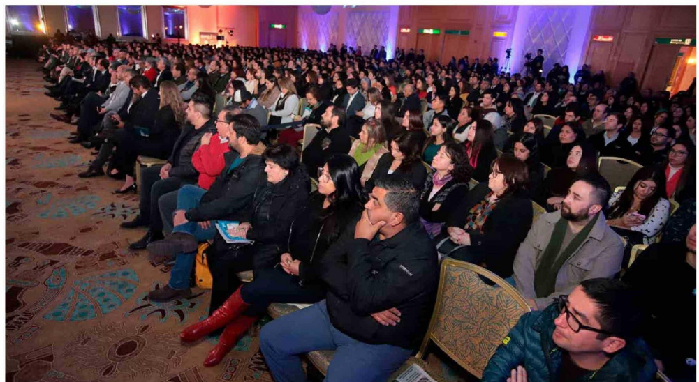
Los espacios del Centro de Conferencias Monticello no dieron abasto a la gran cantidad de asistentes al ENEO 2024.

A este encuentro empresarial que lleva nueve años exponiendo experiencias en nuestra región contó con la asistencia de autoridades regionales, empresarios, profesionales, emprendedores, estudiantes y académicos de distintas instituciones universitarias de la región y el país. 📷