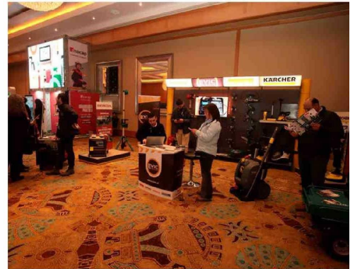
Los stands de empresas auspiciadoras del ENEO 2024 fueron visitadas por los asistentes.