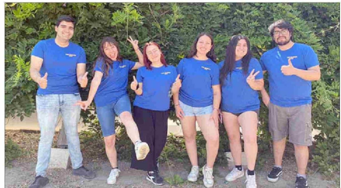
Coordinadores del Preu Solidario UVSF.

del Aconcagua; este tipo de cosas más que nada».