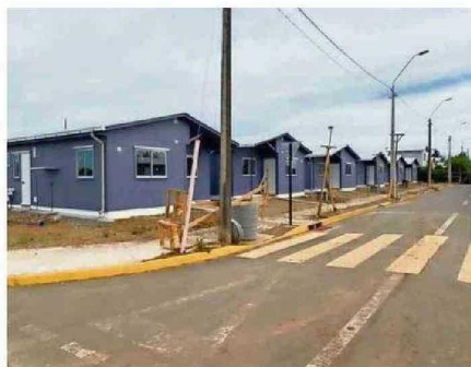
MAÑANA SE ENTREGARÁN 32 VIVIENDAS EN PROYECTO ORO VERDE II.

12 son los campamentos que quedan activos en la región de Ñuble. El 2025 se espera intervenir 2.