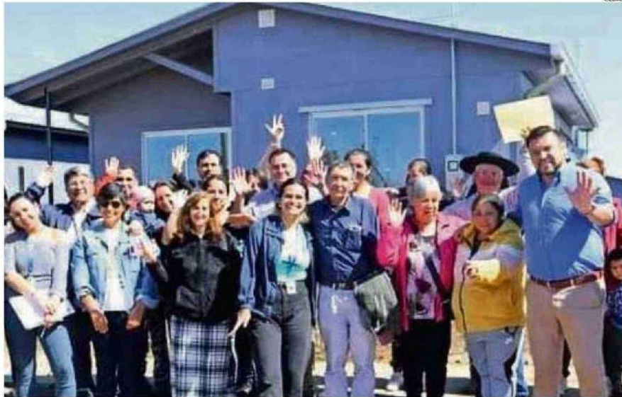
PLAN DE EMERGENCIA HABITACIONAL HA SIDO CLAVE EN PODER INTERVENIR EXITOSAMENTE LOS CAMPAMENTOS EN ÑUBLE.