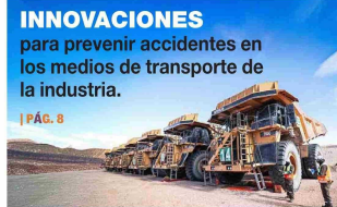
INNOVACIONES para prevenir accidentes en los medios de transporte de la industria.