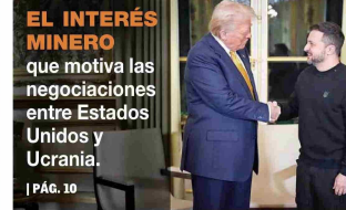
EL INTERÉS MINERO que motiva las negociaciones entre Estados Unidos y Ucrania.