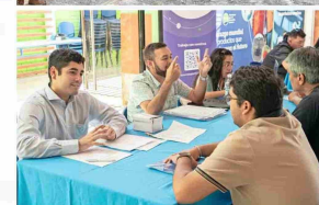
Las ferias laborales están entre las instancias que conectan a la comunidad con las oportunidades en el sector.