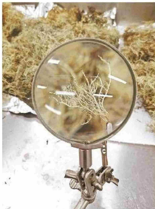
Liquen observado desde la lupa.

Cornejo señala que los medicamentos actuales solo tratan los síntomas y no pueden revertir la enfermedad. "Desde el punto de vista terapéutico, el tratamiento para ambas enfermedades está orientado a la sintomatología y