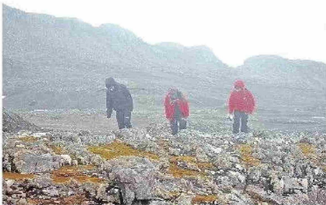
Investigadores en terreno.