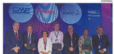
LOS DESTACADOS POR SU TRABAJO EN “INCLUSIÓN”.