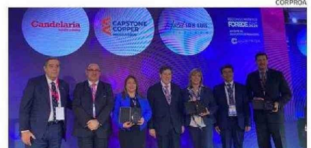
RECONOCIDOS POR “APORTE AL DESARROLLO SOCIAL”.