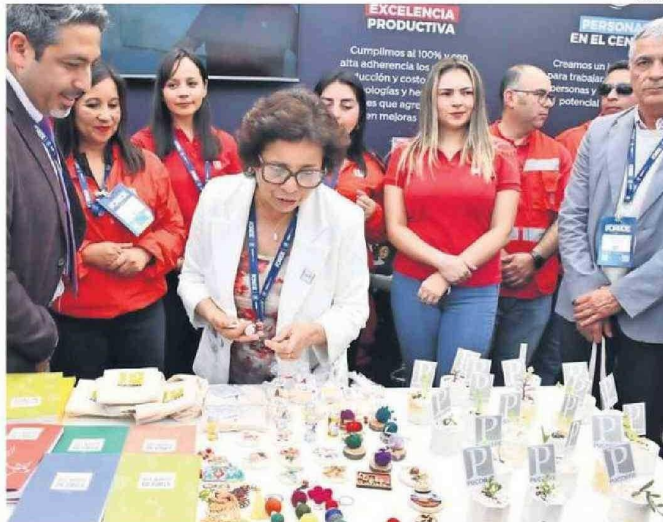
LA MINISTRA WILLIAMS VISITÓ LOS DISTINTOS STANDS DE LAS EMPRESAS.

En términos de Inclusión, se reconoció a CMP, Candelaria