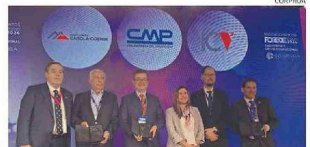
GALARDONADOS EN “SEGURIDAD Y SALUD OCUPACIONAL”.