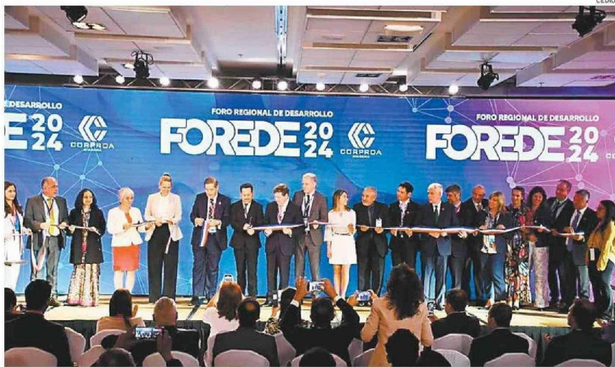
LA CEREMONIA DE INICIO CONTÓ CON LA PRESENCIA DE AUTORIDADES DE NIVEL NACIONAL Y REGIONAL.

Uno de los puntos más destacados del evento fue la realización de las ruedas de negocios, un espacio en el que se estima se llevarán a cabo cerca de 1.000 reuniones entre empresas. Estas actividades no solo permiten la concreción de negocios a corto plazo, sino que también sirven para que los emprendedores locales se conecten con grandes mandantes de la minería. "Esperamos que varios negocios puedan concluirse aquí, pero lo más importante es que las pymes y emprendedores locales se den a conocer y encuentren su espacio en la cadena de valor de la minería", comentó Ronsecco.