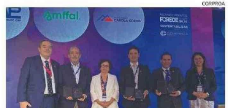
LOS RECONOCIDOS POR “SUSTENTABILIDAD”.