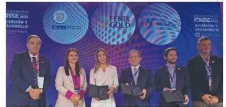
LOS RECONOCIDOS CON EL GALARDÓN EN “INVERSIÓN Y DESARROLLO”.

Finalmente, la ministra Williams valoró la creación de un Clúster Minero en Atacama, explicando que “la creación del Clúster Minero con la adhesión de 13 empresas mineras va a permitir vincularse de mejor manera con el territorio, el empleo local y el desarrollo de proveedores locales que es fundamental para el éxito de la industria minera, que por sí misma sin una cadena de valor que la sustente, sin el talento humano, la verdad que no tiene la fuerza que nosotros hoy día tenemos como país”.