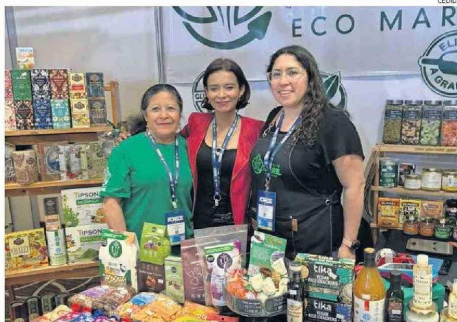
EMPRENDEDORES TAMBIÉN ESTUVIERON PRESENTES CON PRODUCTOS LOCALES.

ria Lunding Mining y Sodexo por su labor en la creación de ambientes laborales inclusivos y diversos. Finalmente, en la categoría de Medios de Comunicación, la Revista Minera Crisol, el Diario Chañarillo y Radio Nostálgica recibieron premios.