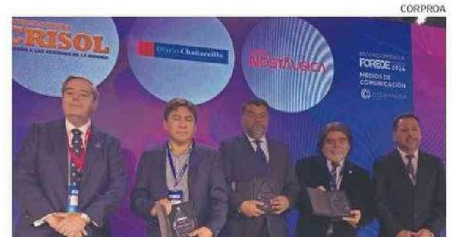
LOS DESTACADOS COMO “MEDIOS DE COMUNICACIÓN”.