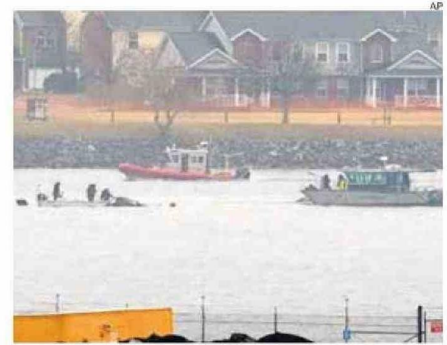
MIEMBROS DE EQUIPOS DE RESCATE AÚN BUSCAN A 14 DESAPARECIDOS.