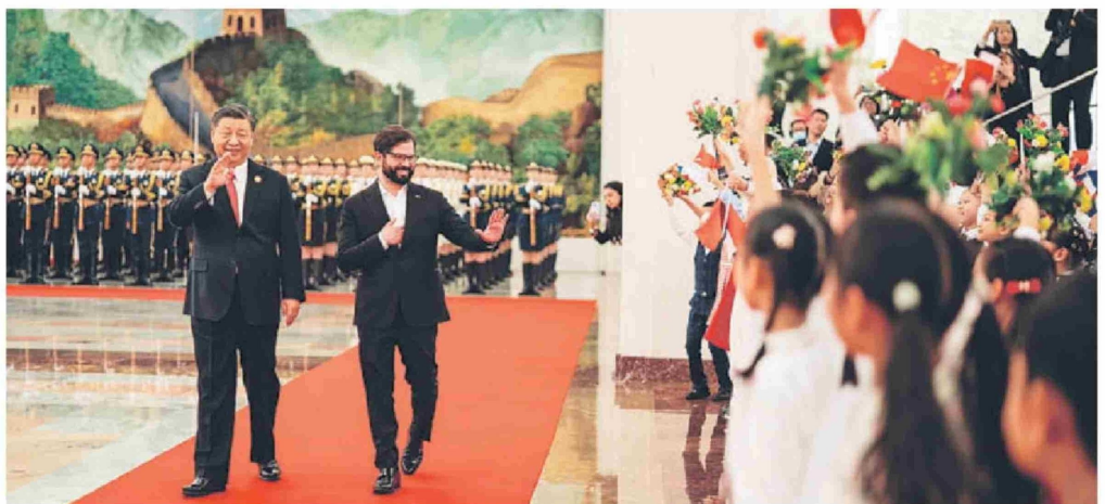
El Presidente Xi Jinping junto al Presidente Gabriel Boric en su visita de Estado a China en octubre de 2023.

El caso de Qinghai es un reflejo de toda China. En las últimas dos décadas, China ha plantado más árboles que el total de todos los demás países, contribuyendo con una cuarta parte del aumento global de áreas verdes. China ha establecido la cadena industrial de energía renovable más grande y completa del mundo, y desde 2012, el consumo de energía por unidad