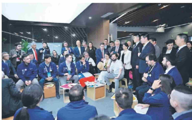
Veinte profesionales visitaron China en el marco del programa New Energy Talent.

de PIB ha disminuido un 26%. Además del desarrollo verde propio, China proporciona el 70% de los componentes fotovoltaicos, el 60% de los equipos de energía eólica y el 60% de los vehículos eléctricos del mundo. Solo en 2023, las exportaciones de productos eólicos y fotovoltaicos ayudaron a los demás países en el mundo a reducir 810 millones de toneladas de emisiones de carbono. En la última década, los costos promedios de la energía eólica y solar a nivel mundial han disminuido en un 60% y 80% respectivamente, y una gran parte de esa reducción de costo se debe a la contribución de China.