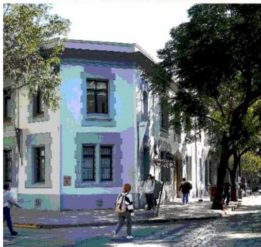
Trabaja en un taller en Almirante Barroso, un barrio que le encanta por estar siempre lleno de universitarios, lo que le da mucha vida.

proceso de restauración puede tomar unos seis meses, dependiendo del grado de deterioro, por eso se comunica con sus clientes a medida que avanza para informar y tomar juntos decisiones importantes. Sabe que muchas veces en sus manos quedan piezas que son verdaderos "tesoros" para sus dueños, quienes le dan un voto de confianza para recuperar publicaciones personales o familiares: "Un libro puede marcar tu infancia, darte memoria emotiva. Por eso cuando restauro