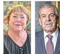
Michelle Bachelet. Eduardo Frei.