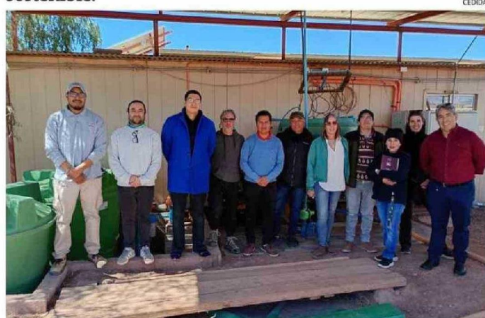
LOS ASPECTOS TÉCNICOS FUERON ENTREGADOS POR PARTE DE PROFESIONALES DE INACAP.

Proyecto regional tiene su principal característica de innovación con base en el desarrollo productivo sostenible.