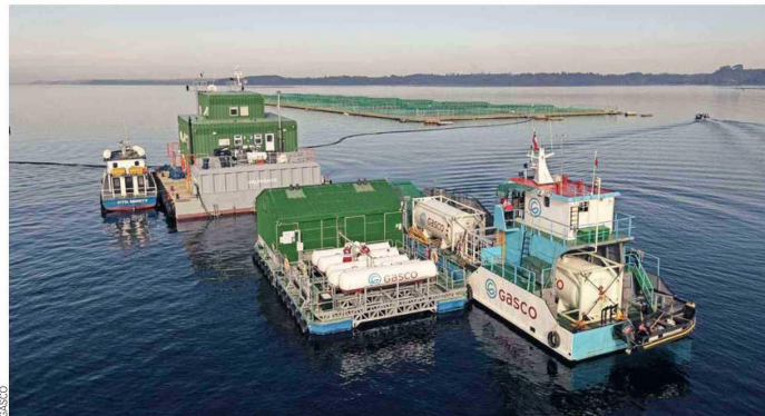
Barcaza GASCO en centro Huenquillahue, Salmones Aysén, Puerto Montt.

Desde Empresas GASCO señalan que avanzan decididamente hacia el objetivo de que el 60% de sus ingresos provengan de nuevos negocios al 2030. En este sentido la compañía —a través de la marca GASCO Minería— continúa trabajando con BHP en la construcción y operación de dos plantas de energía térmica renovable en Minerías Escondida y Spence, Región de Antofagasta, que permitirán reemplazar el diésel de sus instalaciones con paneles termosolares. Asimismo, en una importante faena de Codelco, se está desarrollando una planta para almacenar gas licuado para inyectar calor en la