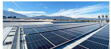
Paneles solares correspondientes al Proyecto GASCO Luz en la empresa PRIMEC, comuna de La Pintana.

Luz ha permitido a múltiples empresas ser más eficientes en su consumo eléctrico sin necesidad de realizar una inversión inicial. En este modelo de negocio, GASCO