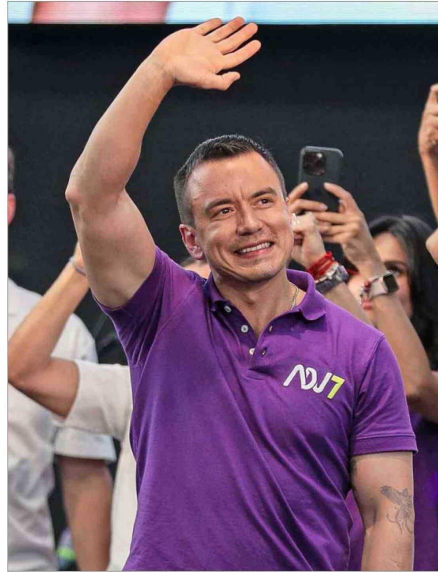
NOBOA busca asumir un segundo período.

El período presidencial de Noboa ha estado marcado por las tensiones con su vicepresidenta, Verónica Abad, a quien ha mantenido al margen de su círculo de gobierno y la ha enviado en dos ocasiones a cumplir funciones especiales a Israel y Turquía. El quiebre se intensificó con la campaña electoral luego de que Daniel Noboa se negara a entregarle el poder, como está estipulado en la ley, para dedicarse a su candidatura, y en cambio, designó por decreto a una vicepresidenta encargada, lo que llevó a Abad a de-