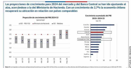
Página 11 de la presentación del ministro de Hacienda, Mario Marcel, el 6 de junio de 2024, en seminario de la Sofía, donde dice que las proyecciones de esa cartera han sido más acertadas que el Banco Central y el mercado.

"Es cierto que la política fiscal se guía a partir de la regla del balance cíclicamente ajustado, el