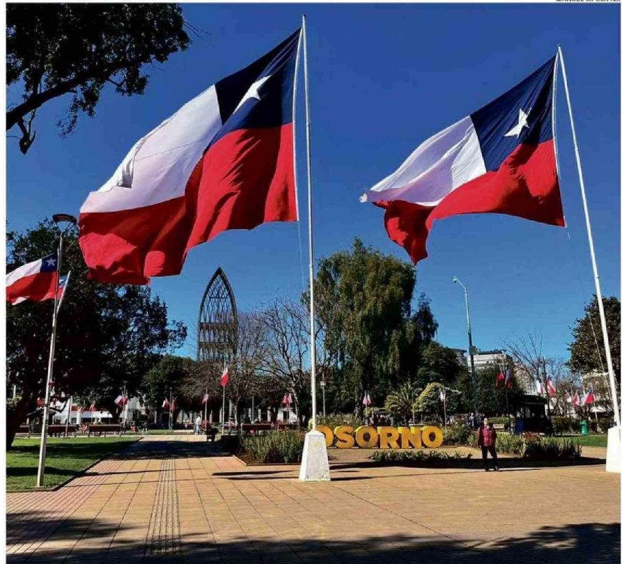
EN LA PLAZA DE ARMAS ESTÁ EL PABELLÓN NACIONAL, DONDE SE REALIZARÁ EL IZAMIENTO DE LAS BANDERAS ESTE DOMINGO 1 DE SEPTIEMBRE.

Este año, el fin de semana largo del "18" está calendarizado para los días martes 17, miércoles 18, jueves 19, viernes 20, sábado 21 y domingo 22 de