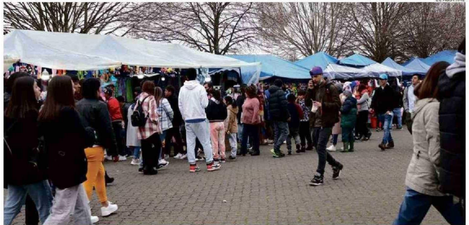
EN EL PARQUE CHUYACA SERÁN LAS ACTIVIDADES ORGANIZADAS POR EL MUNICIPIO, CON ENTRADA LIBERADA A PARTIR DEL MARTES 17 DE SEPTIEMBRE.

será la parada militar, a partir de las 12 horas en la plaza de Armas. Contará con la participación del Destacamento de Montaña N°9 Arauco, Carabineros, Armada, entre otros.