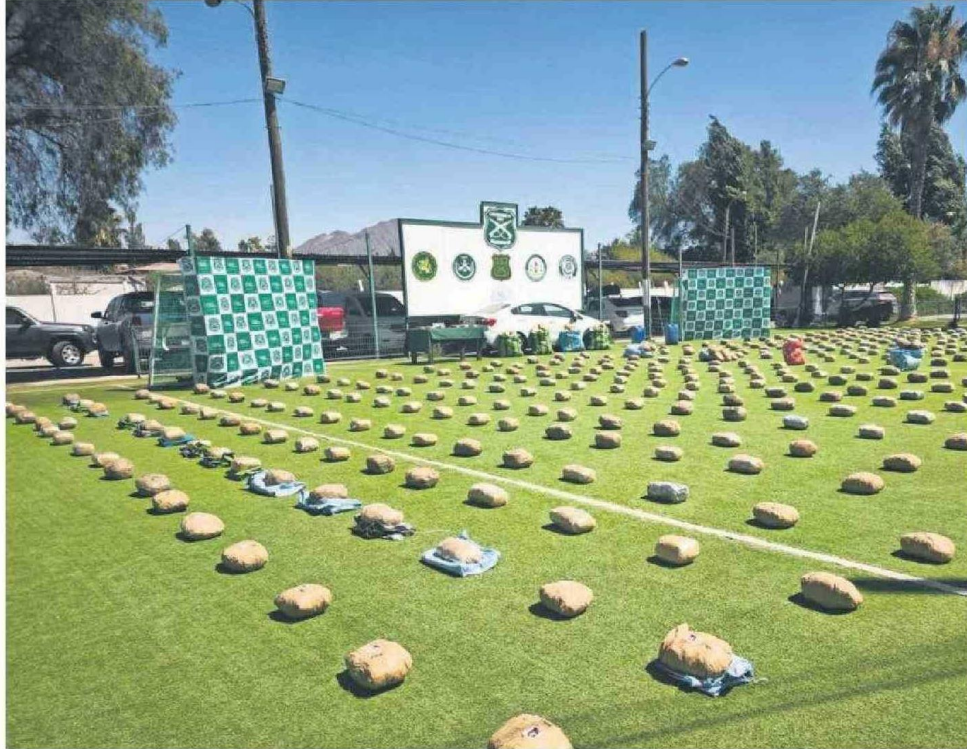
LA DROGA Y UNO DE LOS VEHÍCULOS INCAUTADOS.

“El trabajo de la Unidad Sacfi de la Fiscalía permitió realizar una función investigativa de excelencia junto a funcionarios de Unidades especializadas de Carabineros, dejando como resultado la detención de dos personas de nacionalidad boliviana, además de un tercer imputado chileno que cumplía con tareas de punta de lanza”