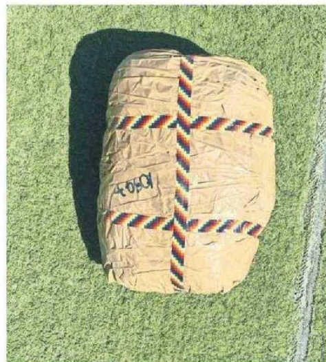
UN DISTINTIVO DE PAQUETES, ERA LOS COLORES DE BOLIVIA.

“El trabajo de la Unidad Sacfi de la Fiscalía permitió realizar una función investigativa de excelencia junto a funcionarios de Unidades especializadas de Carabineros, dejando como resultado la detención de dos personas de nacionalidad boliviana, además de un tercer imputado chileno que cumplía con tareas de punta de lanza. Gracias a ello, se detectó la droga que era transportada en dirección al sur del país entre marihuana y pasta base de cocaína”, dijo el fiscal re-