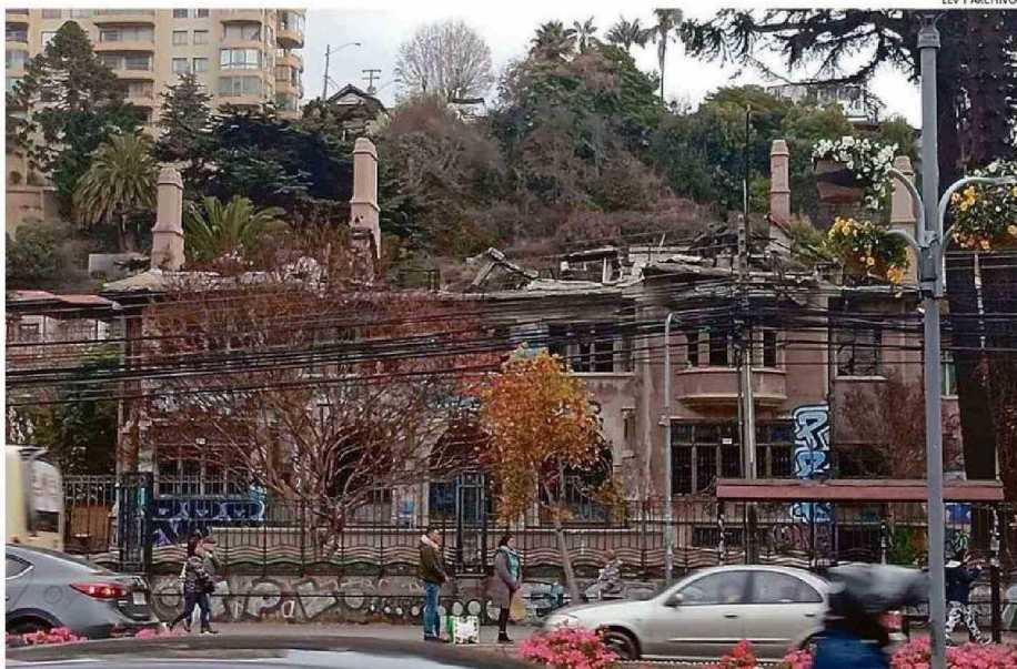
LEV Y ARCHIVO.