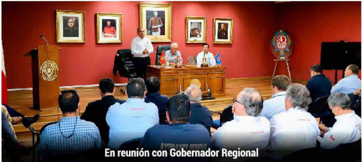
En reunión con Gobernador Regional

En la oportunidad, la autoridad de la región de O'Higgins conoció el planteamiento de los 33 cuerpos de voluntarios y le informó respecto a una nueva fórmula que cuenta con toma de razón por parte de la Contraloría General de la República.