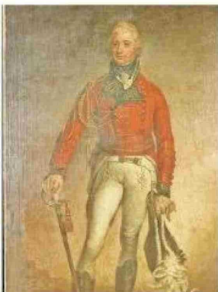
Sir Thomas Picton.

bierno de la República de Chile y el gobierno de la República de Argentina el Tratado de Paz y Amistad; la nación argentina reconoció la soberanía chilena sobre las islas del Beagle, en especial sobre la isla Picton.