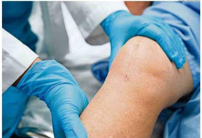
La investigación revisó más de un siglo de estudios sobre el tema.

Por ejemplo, identificar las peculiaridades de la señalización en heridas respecto a tejidos intactos, como la re-