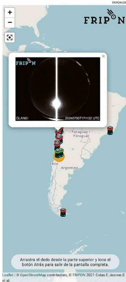
Leaflet | © OpenStreetMap contributors, © FRIPON 2021 Colas.F, Jeanne.S et al.

El análisis de las imágenes obtenidas por las cámaras FRIPON ha permitido establecer que el bólido emitió su brillo cuando el cuerpo se encontraba entre los 85 y los 25 km de altura sobre la superficie. La primera velocidad medida fue de 18 km/s (unos 64,800 km/h) y debido al roce atmosférico se redujo sustancialmente su velocidad a apenas 6 km/s (21,600 km/h) cuando se terminó el fenómeno luminoso. Esto indicaría una alta probabilidad de que poco después el material del meteorito sobrevivió a esta primera parte de su trayectoria y continuó su camino final sin emisión de luz (vuelo oscuro) hasta llegar al suelo, convirtiéndose entonces en un meteorito. Las mediciones de brillo (fotometría) del bólido, indican que el meteorito alcanzó una magnitud absoluta de -9, saturando las cámaras por un par de segundos de los cinco en total que duró el evento. Como referencia, el brillo de