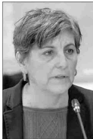
La ministra Ximena Aguilera dijo que "se está estudiando la posible reposición del hospital".

Estado indicó que se está dotando con diversas iniciativas al hospital liguano. "El Hospital se ha complementado con la unidad de diálisis, ahora con un mamógrafo y se está estudiando la posible reposición del hospital, que también es relevante. Continuamos interesados en seguir proyectando todo lo que se necesite en la ciudad", planteó.