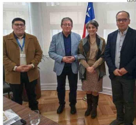
LAS AUTORIDADES LOCALES SE REUNIERON CON LA MINISTRA DE SALUD.