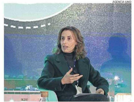
“NO SÉ QUÉ PRETENDE LA IZQUIERDA”, SE PREGUNTÓ LA CANDIDATA.