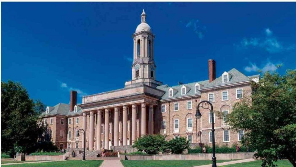
Universidad de Pennsylvania.

30 jóvenes chilenos han participado de esta gran experiencia con el programa que ofrece Banco Santander.