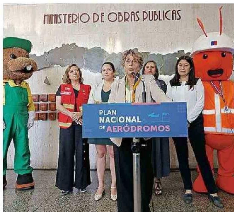
LA MINISTRA JESSICA LÓPEZ EN LA PRESENTACIÓN DEL PLAN.

Además, se construirá una plataforma de estacionamiento para cinco aeronaves, calles de rodaje conectadas a la pista y un punto de posada para helicópteros pesados, de acuerdo con antecedentes proporcionados a través de la Secretaría Regional