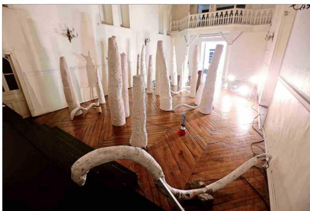
"Un día antes", de Melania Lynch, se presenta en el Centro Cultural Montecarmelo de Providencia.

Una propuesta en torno a la existencia y al hongo prototaxites coincide en agosto con piezas lumínicas vinculadas a lo ancestral. Asimismo, muestras colectivas dan luces de la actualidad y de esculturas esenciales.