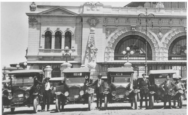
Taxistas de Santiago en 1917.