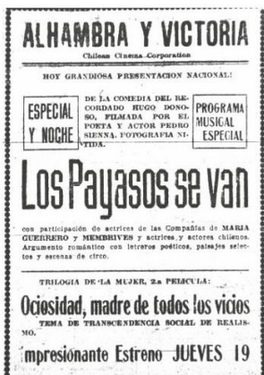
Anuncio de la exhibición de la película "Los payasos se van", en 1921, en Santiago, dirigida por Pedro Sienna.