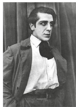
Pedro Sienna, director y actor de "Los payasos se van", de 1921.

H ugo Donoso Gaete, talento premonitorio desde casi la adolescencia, nació en Santiago el 5 de enero de 1899. Fue alumno, como tantos de esa época, del Instituto Nacional. Al egresar, siguió la carrera de leyes en la Universidad de Chile. Desde casi los trece años inició colaboraciones literarias en "Zig-Zag", con el seudónimo de Hugonote. Hizo crítica de libros y dio a conocer poemas de innegable talento.