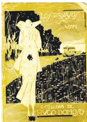
Portada de la comedia "Los payasos se van", editada en 1916 y hoy muy difícil de ubicar.