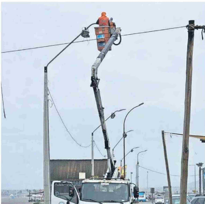
SE REALIZARON LAS REVISIONES CORRESPONDIENTES EN EL TENDIDO DEL SECTOR.

Autoridades llevaron hasta el sector para conocer en terreno las demandas de los locatarios in situ.